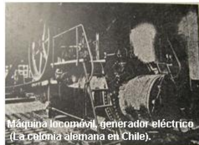
Máquina locomóvil, generador eléctrico (La colonia alemana en Chile).