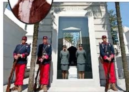
Los Veteranos del 79, con indumentaria de la Guerra del Pacífico, acompañaron ayer la ceremonia, que contó con unos 500 participantes.